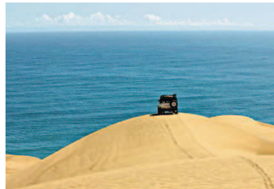
Tot hier toe. Op die Faces of the Namib-toer kom see en woestyn by die Sandvishawe bymekaar. Onder teen die duine wei honderde flaminke.

Voertuie is ook nie gespaar nie. Die vlugvoetige Prado het die “Silwer Valkie” geword en die naam van Sats se FJ is verander na FY. (Die “F” vir “niks” en die “Y”