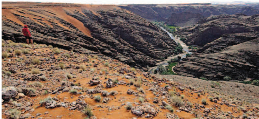
Daar's water! Die Kuisebskeurvallei met steil rotswande, waardeur die gelyknamige rivier vloei. Dié rivier het hoogstens twee maande per jaar water, gewoonlik in Februarie en Maart, en dis 'n besondere gesig.