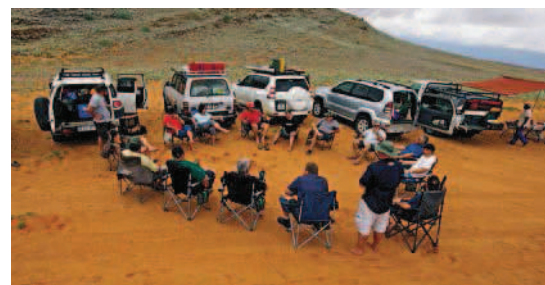
Tyd vir uitspan. Die groep sit aan vir hul eerste middagete in die woestyn. Dis nou nog voel-voel en die duine is nog klein. Almal raak gaandeweg vertrouwd met duinrytgenieke.