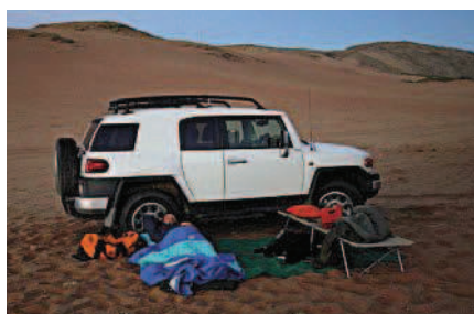
Kamp sonder tierlantyntjies. Die aande waarop wind die dou verjaag, kan jy onder die sterrehemel slaap sonder tent. As die ander voertuie aanskakel om te ry, hoef jy omtrent eers op te pak.